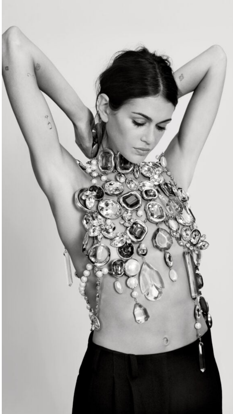
Kaia Gerber dans la campagne Givenchy automne-hiver 2025.

et des parcours, loin d'une représentation uniforme de la mode.