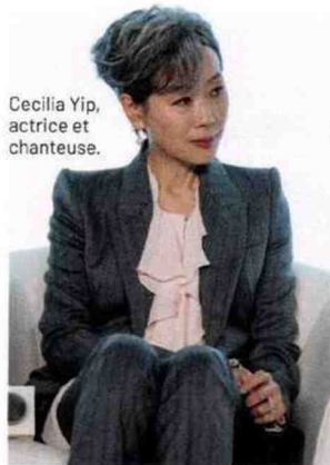
Cecilia Yip, actrice et chanteuse.