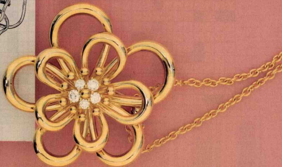
Pendentif Flowerlace en or jaune et diamants.